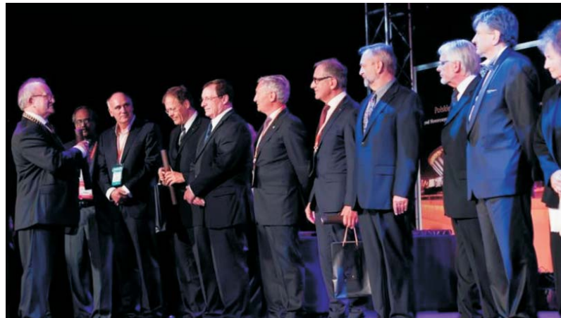
Fot. 7. Wręczenie tytułu „Honorowego Członka Polskiego Towarzystwa Ginekologicznego podczas Ceremonii otwarcia Kongresu – Hala Widowiskowo-Sportowa „Spodek” w Katowicach