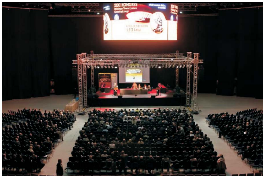
Fot. 3. Walne Zgromadzenie Delegatów Polskiego Towarzystwa Ginekologicznego – Hala Widowiskowo-Sportowa „Spodek” – Katowice