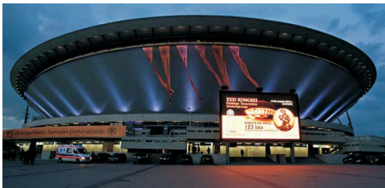
Fot. 1. Hala Widowiskowo-Sportowa „Spodek” w Katowicach