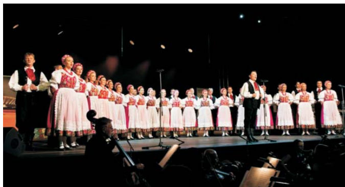
Fot. 9. Występ Zespołu Pieśni i Tańca „Śląsk” – Ceremonia otwarcia Kongresu – Hala Widowiskowo-Sportowa „Spodek” w Katowicach