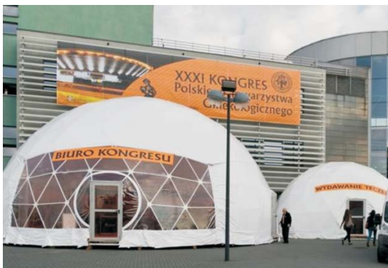
Fot. 2. Wydział Prawa i Administracji Uniwersytetu Śląskiego w Katowicach