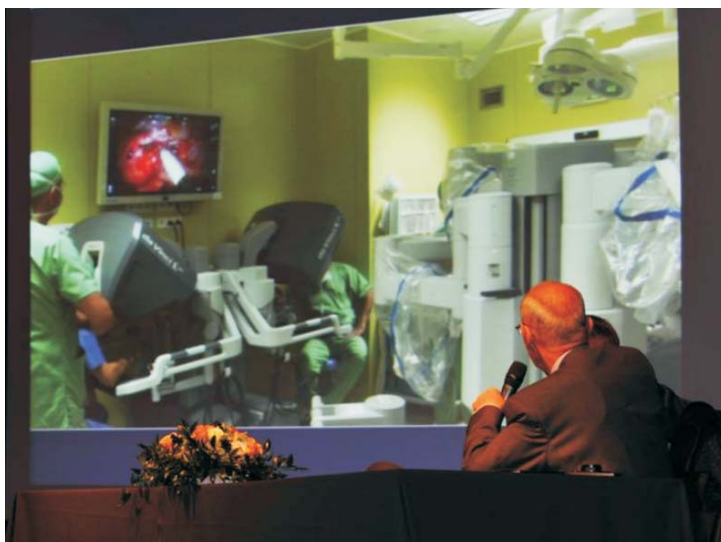
Fot. 4. Transmisja satelitarna operacji ginekologicznej z zastosowaniem robota Da Vinci ze Szpitala Specjalistycznego we Wrocławiu do Hali Widowiskowo-Sportowej „Spodek” w Katowicach