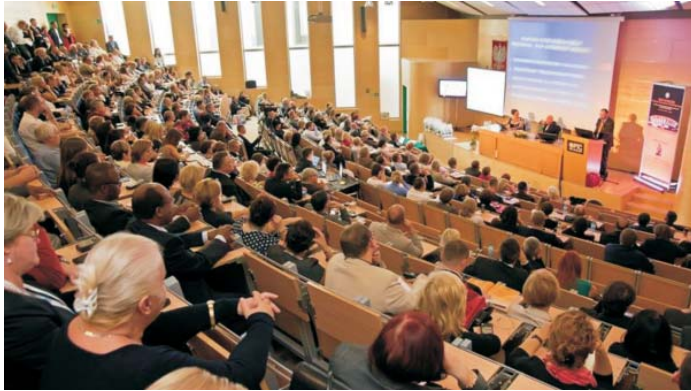
Fot. 6. Sesje naukowe – Wydział Prawa i Administracji Uniwersytetu Śląskiego w Katowicach