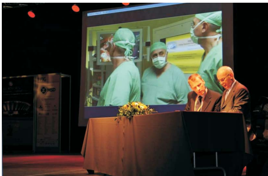
Fot. 5. Transmisja satelitarna operacji ginekologicznej z zastosowaniem robota Da Vinci ze Szpitala Specjalistycznego we Wrocławiu do Hali Widowiskowo-Sportowej „Spodek” w Katowicach