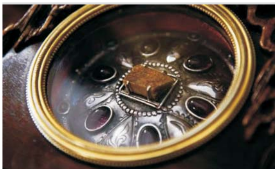
Ryc. 4. Cerkiew na Bacieczkach. Relikwia, fragment czaszki świętych Kosmy i Damiana

Historia niestety z trudem weryfikuje to, co wiemy o świętych braciach – bliźniętach. Prawosławna hagiografia uznaje aż trzy pary świętych braci o imieniu Kosma i Damian, którzy żyli w tym samym stuleciu [16]. Pierwsza pochodzi z Azji Mniejszej (ewentualnie z Mezopotamii). Według niej bracia lekarze zginęli śmiercią męczeńską około 300 r. w Cyrze. Tam też znajduje się ich grób (według innego podania w Tamman w Mezopotamii). Ich święto obchodzone jest 1 listopada.