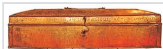
Ryc. 6. Relikwiarz św. Kosmy i Damiana. Skarbiec kościoła Najświętszej Marii Panny w Krakowie.