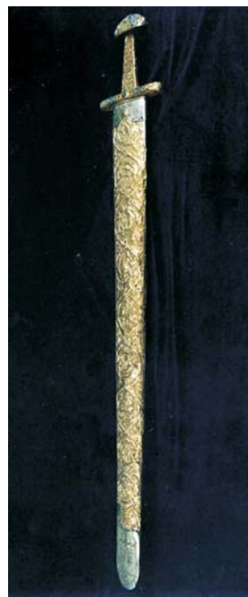
Ryc. 2. Miecz Kosmy i Damiana. Skarbiec katedralny w Essen

Według innej wersji, po aresztowaniu, Kosmę i Damiana przewieziono do Rzymu, gdzie zostali uwięzieni i postawieni przed sądem. W trakcie procesu otwarcie wyznawali swoją wiarę i stanowczo odmówili złożenia ofiary pogańskim bogom mówiąc „... nikomu nie wyrzadziliśmy zła, nie jesteśmy zaangażowani w magię lub czary, o które nas oskarżacie. Leczymy chorych dzięki pomocy naszego Boga i nie bierzemy żadnej zapłaty za udzielanie pomocy chorym,