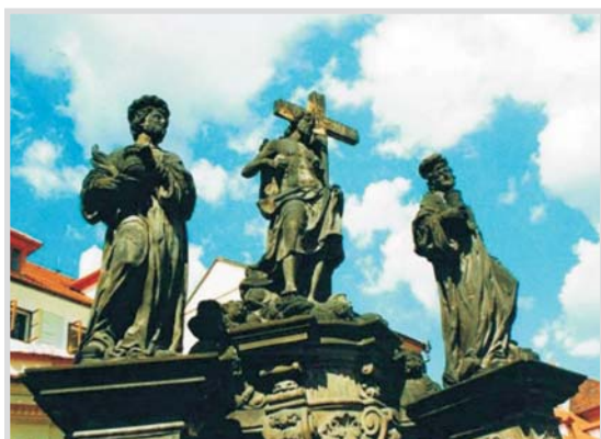
Ryc. 5. Święci Kosma i Damian. Pomnik na moście Karola w Pradze